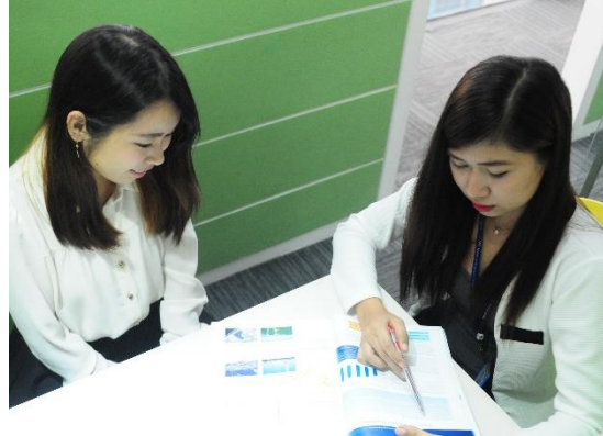
◆ マンツーマンレッスン室