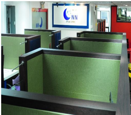
◆ マンツーマンレッスン室