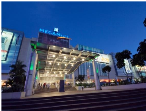
◆ SM MEGA MALL