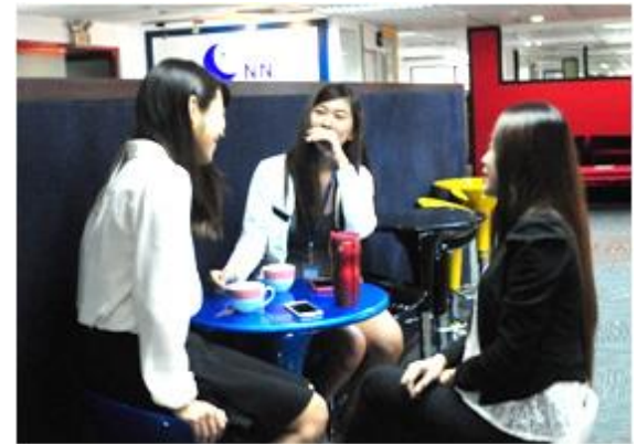
◆ スタディラウンジ