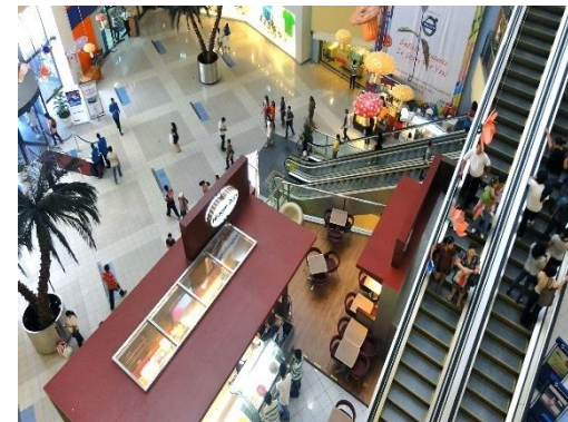
◆ Shangri-La Plaza