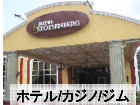
ホテル/カジノジム