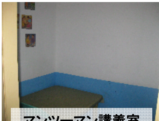
マンツーマン講義室