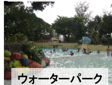
ウォーターパーク