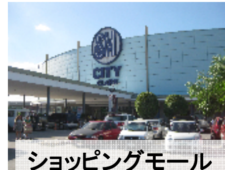
ショッピングモール