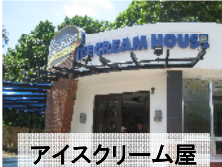
アイスクリーム屋