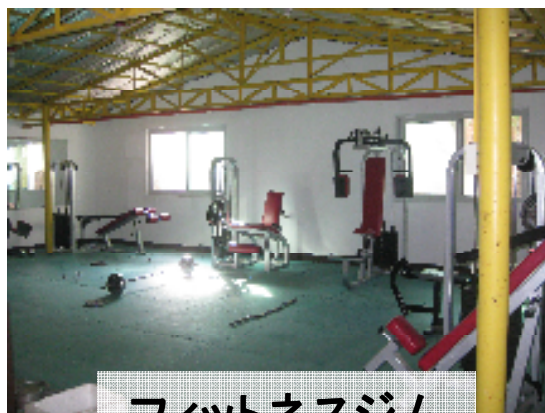
フィットネスジム