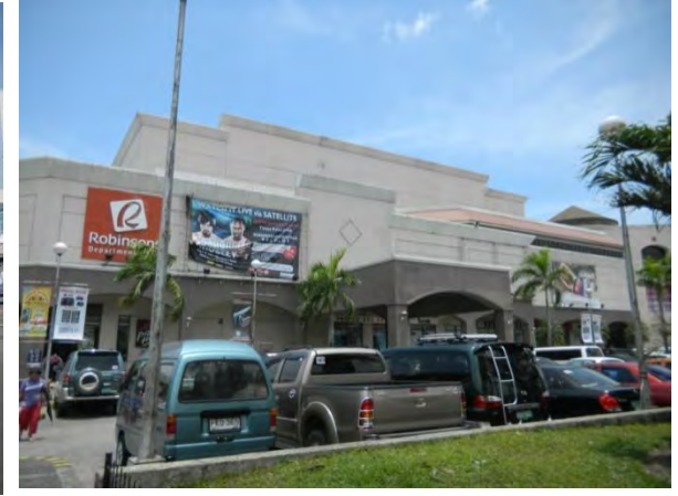
ロビンソン(学校から約30分)