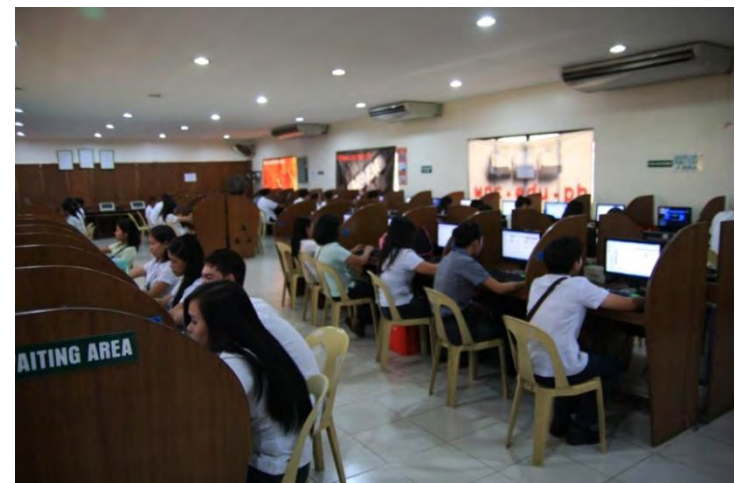
コンピューター室