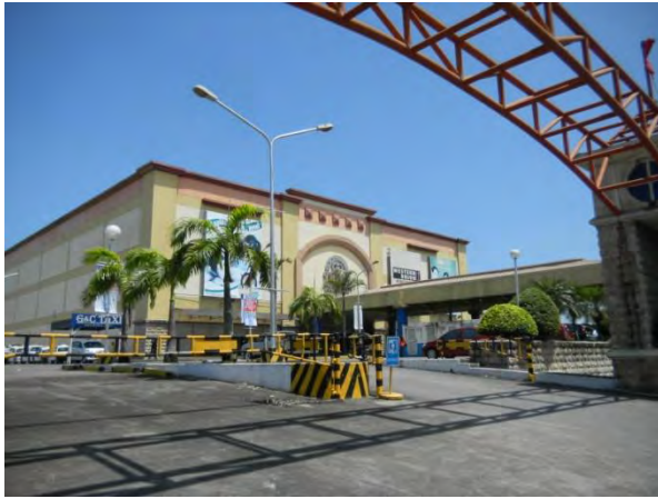
ガイサノ(学校から約5分)