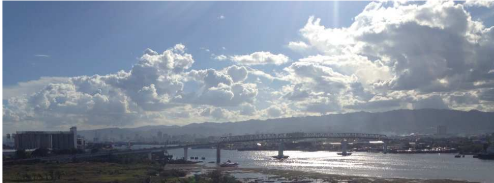
オールドブリッジ方面