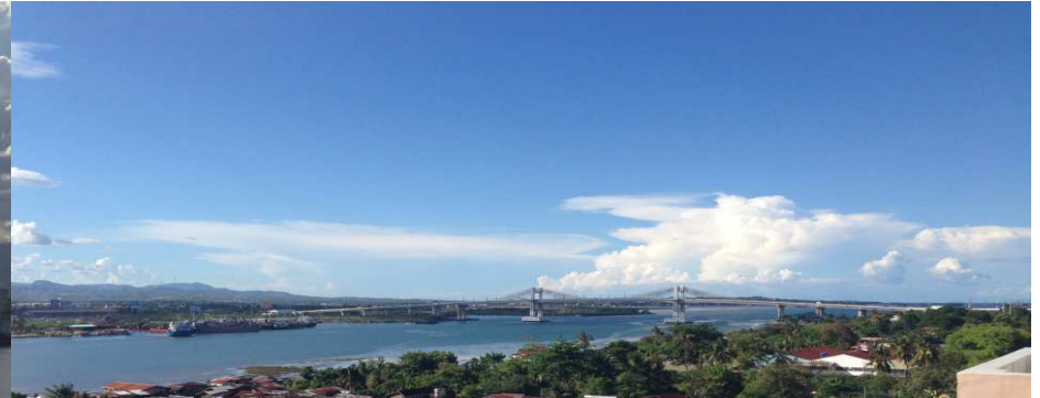
ニューブリッジ方面