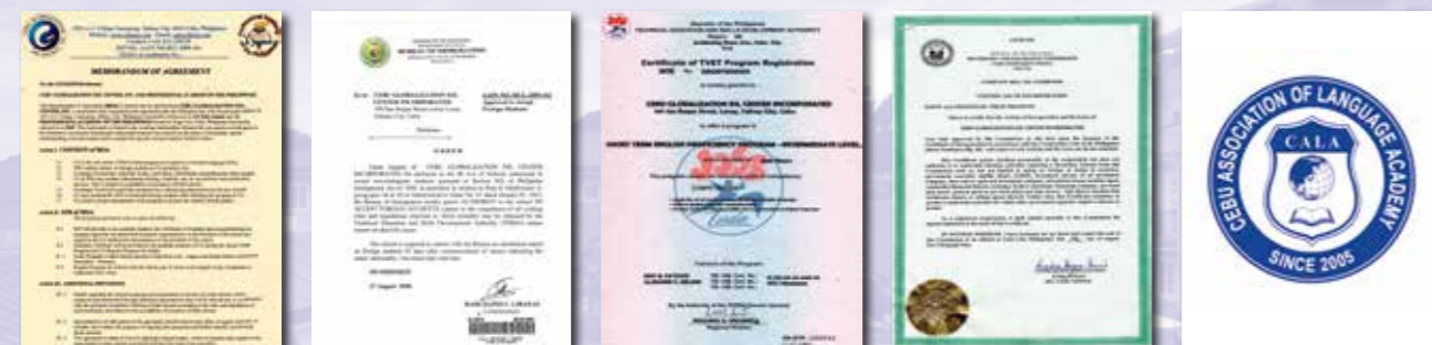
PAP大学付属MOA 締結 フィリピン移民局SSP認証 フィリピン教育部TESDA認証 フィリピンSEC認証 セブ語学院協会会員