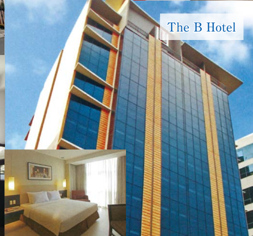
The B Hotel