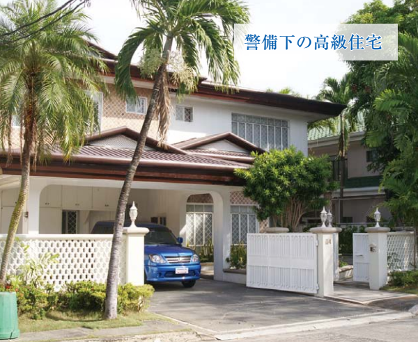
警備下の高級住宅