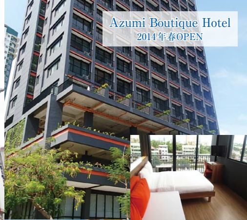
Azumi Boutique Hotel 2014年春OPEN