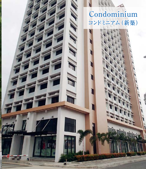
Condominium コンドミニアム (新築)